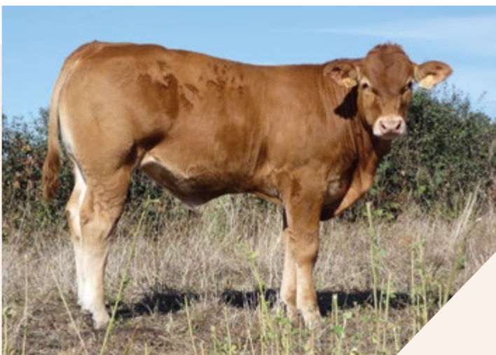
Gaec Breugnot-Sy - 58.