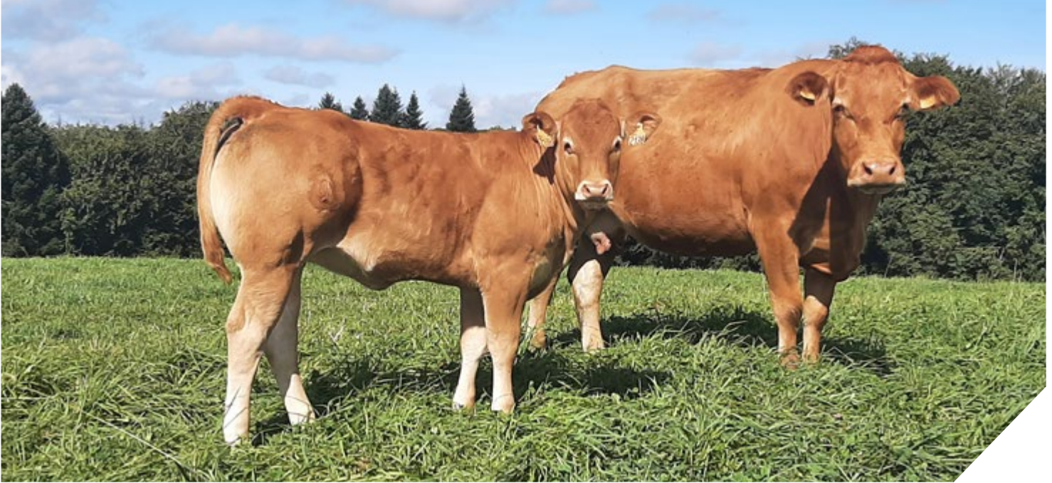
Gaec Senejoux-Magnaval - 19.