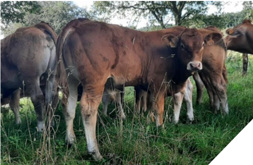
Gaec Senejoux-Magnaval - 19.