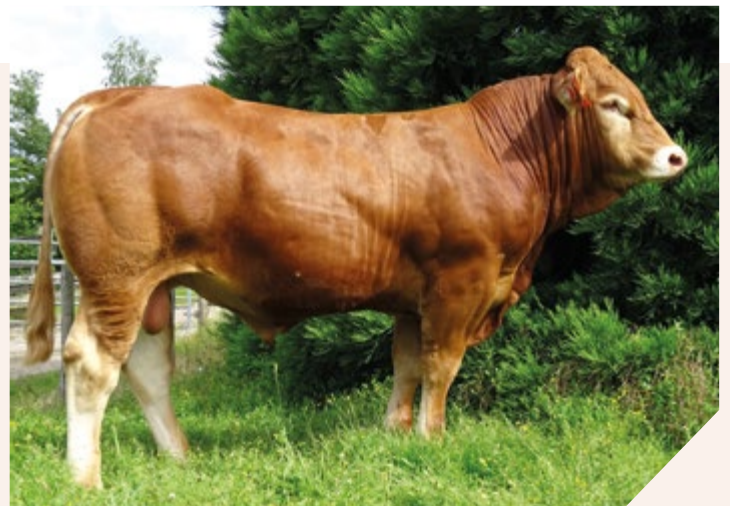
RED P MN, à sa sortie de Lanaud.