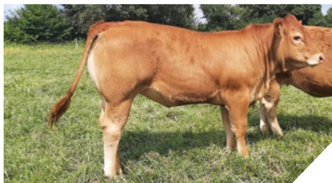
Gaec de la Martinière (49).